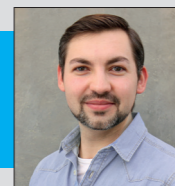
ZT Sergi Kühn Anwendungstechnik